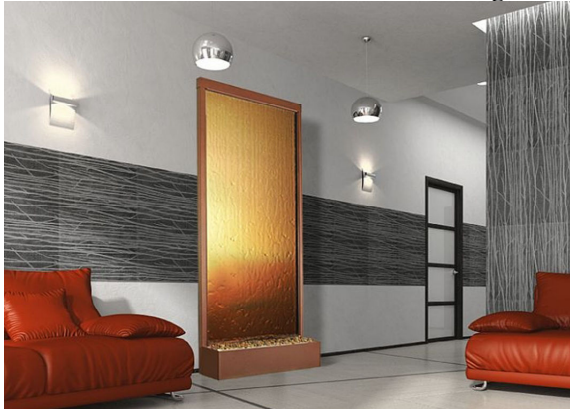
Mod.: Studio 100200 colore bronzo e Plexglas