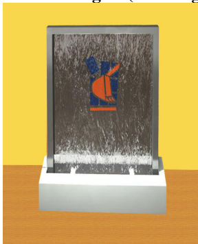
Mod.: 100150 Inox + Plexglas (con Logo)